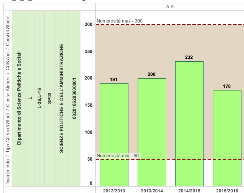
A1_1_1_2 Isritti I anno graf