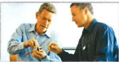
Scarica la Brochure Special Alloys