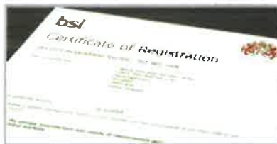
Scarica il Certificato ISO 9001:2015