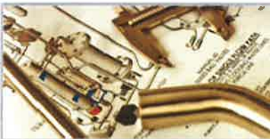
Scarica i Sales Drawings