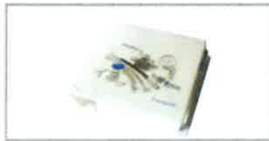
Scarica i Cataloghi dei Prodotti