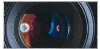
Nordival.com Video Tutorials