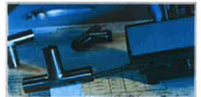
Guarda i Certificati disponibili